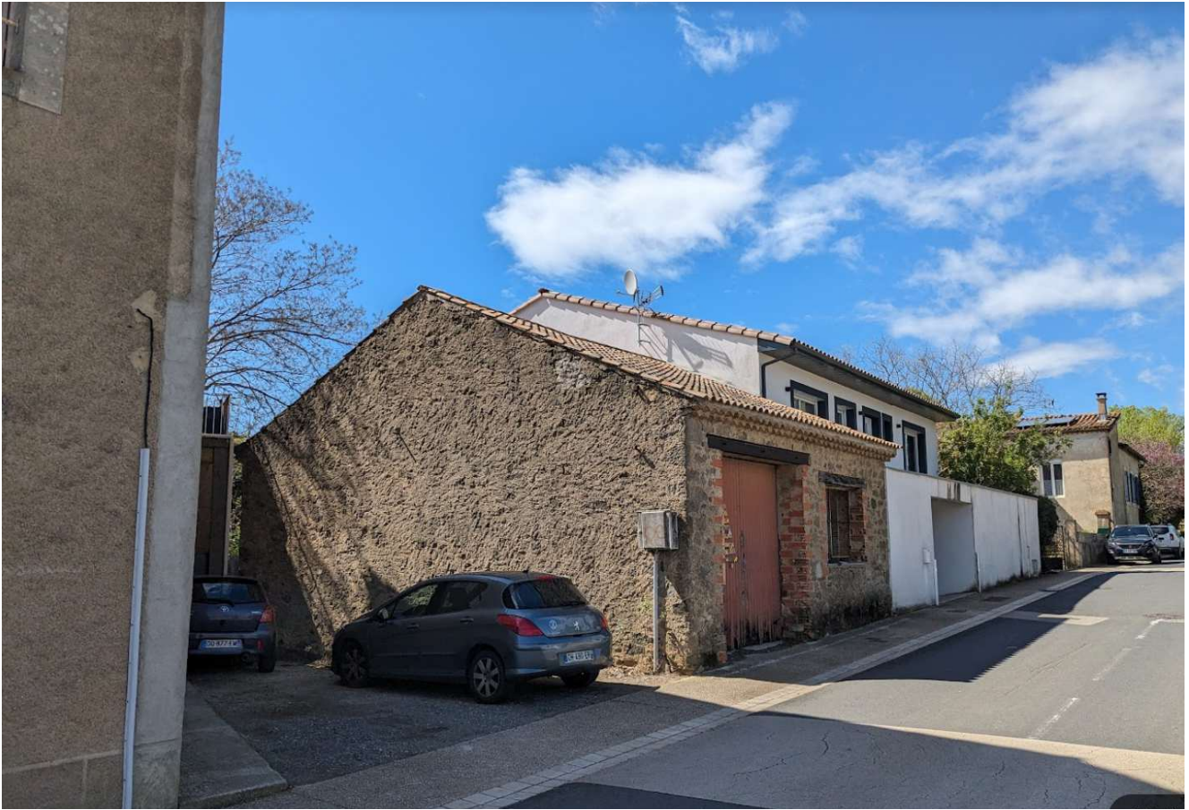
Point de VUE - PC8