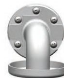
Schéma technique :