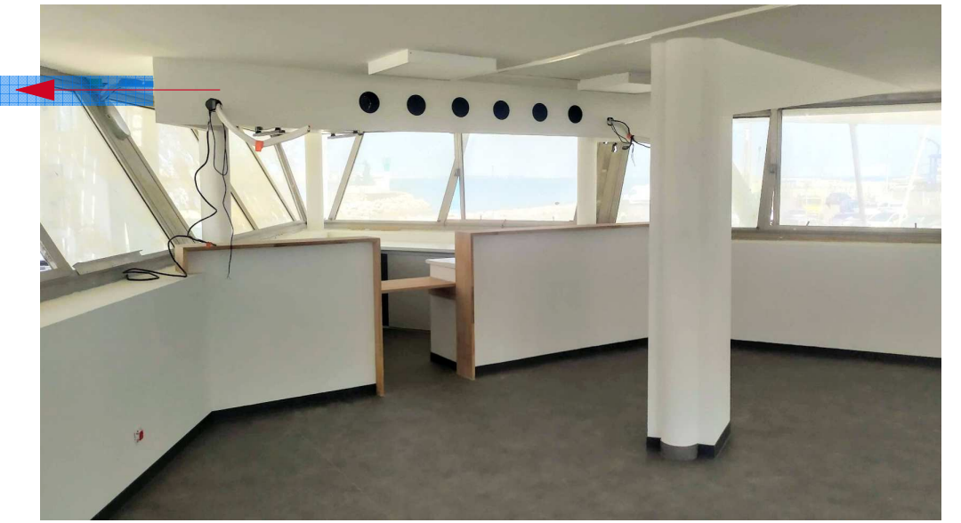
Etat des lieux Yacht-club