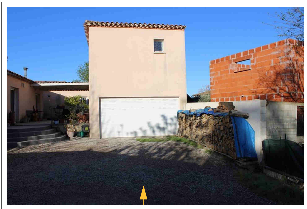
Point de VUE - PC8