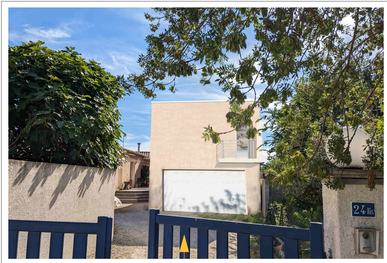
Point de VUE - PC8