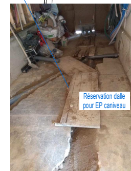
Réservation dalle pour EP caniveau