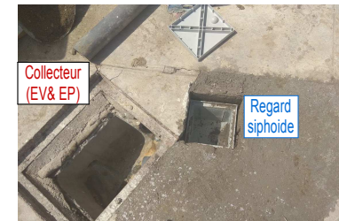
Collecteur (EV&EP) & regard siphoine