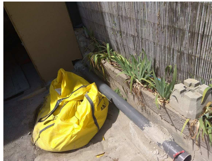
EVACUATION EP - Diam. 160 mm