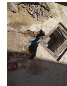
Collecteur (EV&EP) avant la pose du regard siphoine