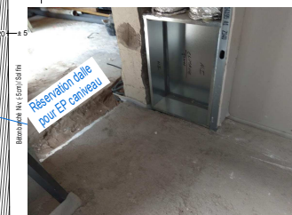
Réservation dalle pour EP caniveau