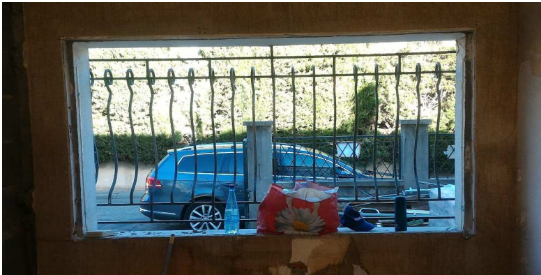
▼ 02 - Dépose couissant