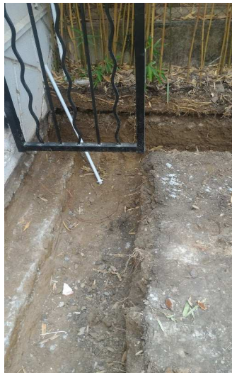
Fouille pour jardinière - 11 ▼