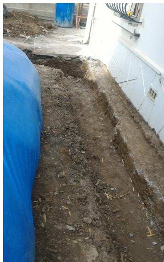
▼ 09 - Fouille pour renfort de fondation - 10 ▼