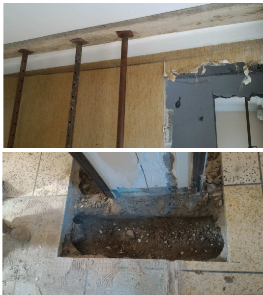
▼ 13 - Etalement provisoire - ▼