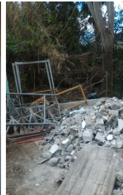
▼ 03 - Gravoit