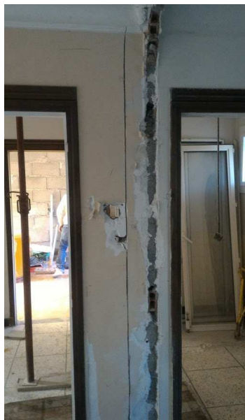
▼ 12 - Position du Pilier BA