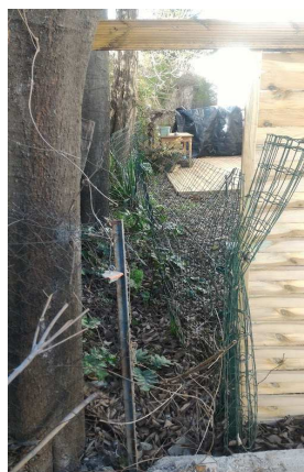
▼ 06 - Arbre à supprimer - 07 ▼