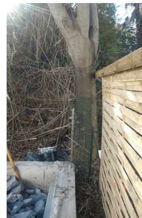
▼ 06 - Arbre à supprimer - 07 ▼