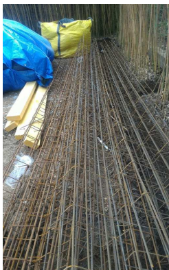
▼ 01 - Approvisionnement armature